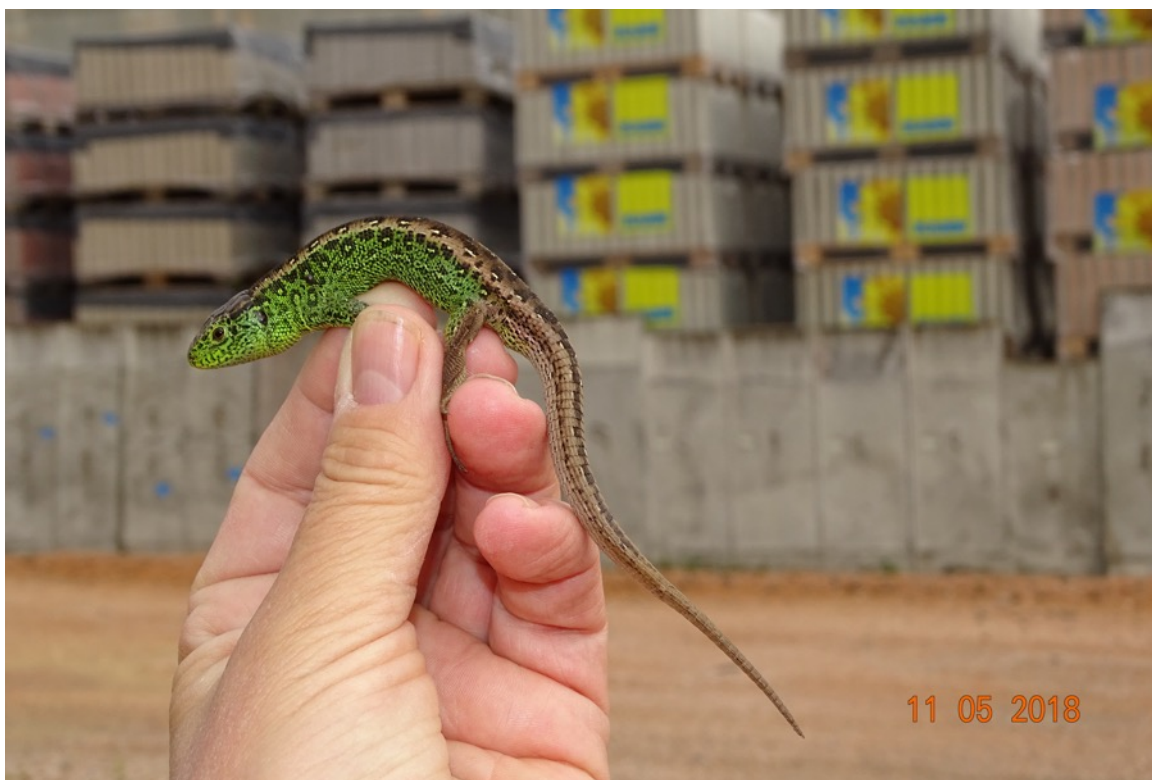
Abb. 7: Männliche Zauneidechse auf dem Grünstreifen am südlichen Rand des Betriebsgeländes.