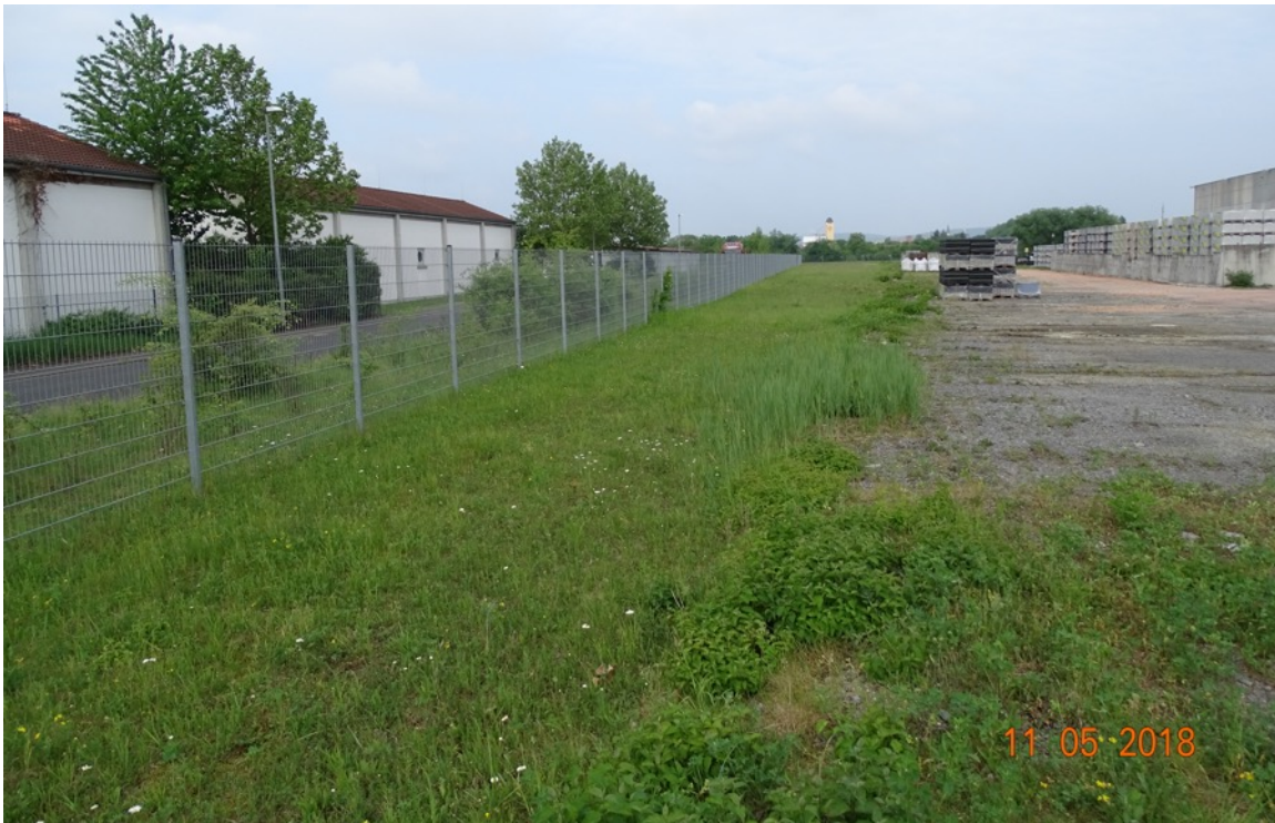
Abb. 8: Der Grünstreifen am Südrand des Betriebsgeländes ist Zauneidechsenhabitat. Der Fundort des Männchens lag etwa auf Höhe der weißen Bigpacks. Am rechten Bildrand schließt das Baufeld des Regenrückhaltebeckens an.