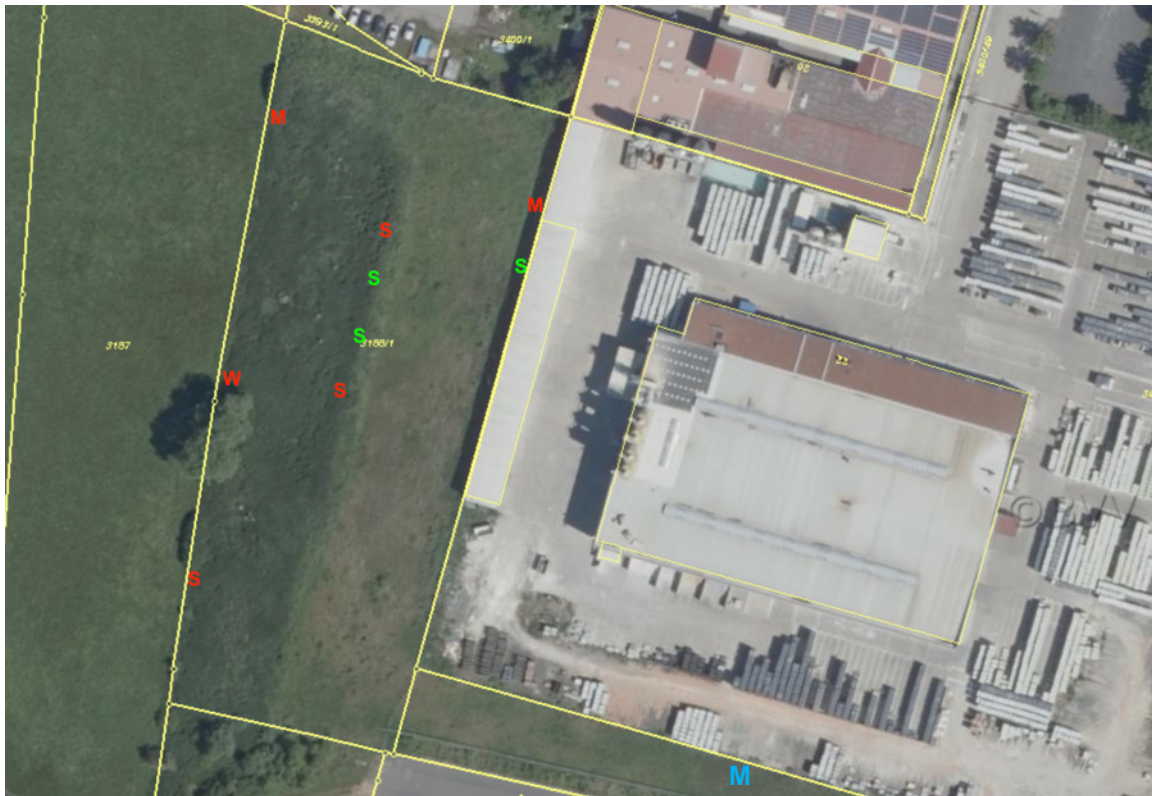
Abb. 6: Zauneidechsenfunde auf dem Gelände der Fa. KANN rot = Funde am 17.04.18, grün = Funde am 27.04.18, blau = Fund am 11.05.18 S = Subadult, W = Weibchen, M = Männchen