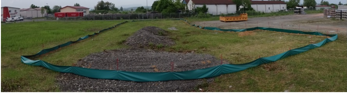
Abb. 10: Der im Bereich von Zauneidechsenhabitaten liegende Teil des Baufeld des Regenrückhaltebeckens wurde bereits mit einem Reptilienzaun abgesperrt.