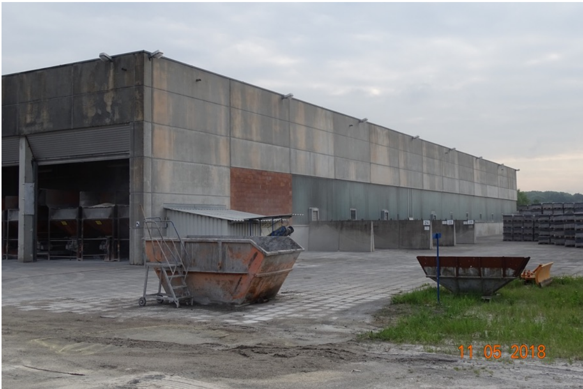
Abb. 2: Südseite des Betriebsgebäudes, die Fassade besitzt keine für Fledermäuse geeigneten Spalten