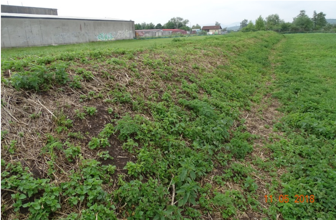
Abb. 5: Die Erdmiete auf der Brachfläche ist Ganzjahreslebensraum und mögliches Fortpflanzungshabitat für Zauneidechsen.