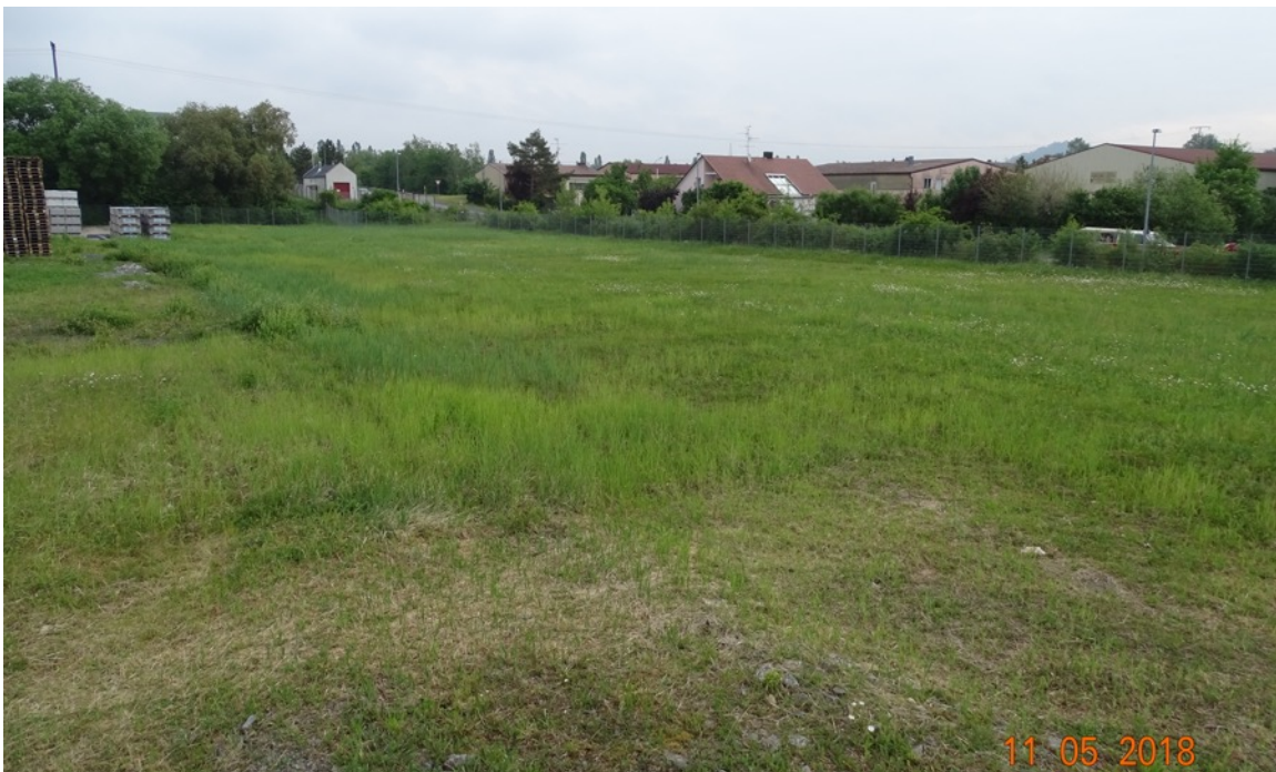
Abb. 9: Die Grünfläche am Ostrand des Betriebsgeländes ist teilweise sehr bodenfeucht. Hier sind allenfalls Zauneidechsennahrungshabitate zu vermuten.