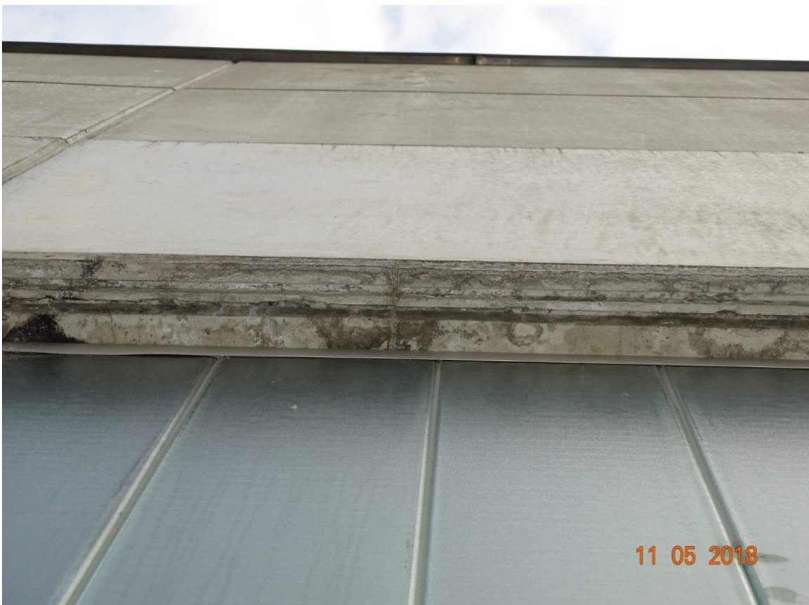
Abb. 3: Südseite des Betriebsgebäudes, Detailansicht der Fassade mit Einblick in den Spalt hinter dem Dachabschlussblech