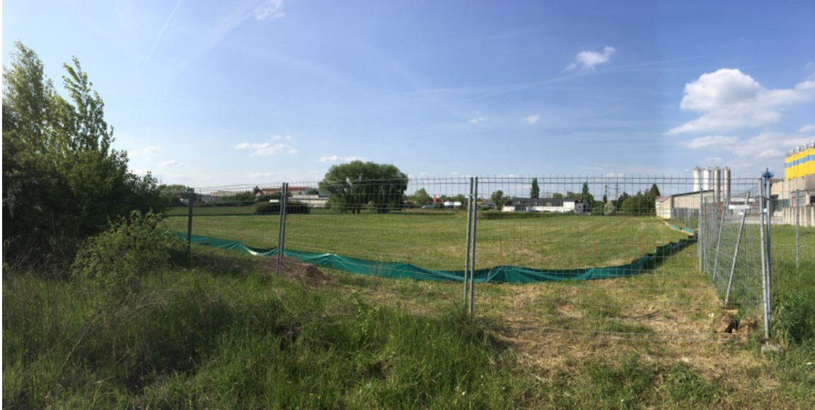
Abb. 4: Die Brachfläche Fl.-Nr. 3188/1, auf der die neue Lagerfläche errichtet werden soll, ist bereits mit einem Reptilienzaun abgesperrt.

Im gezäunten Bereich habe ich bisher keine Zauneidechsen beobachtet.