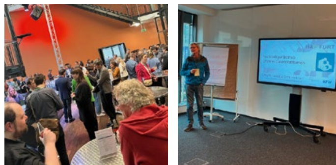
Impressionen vom Kongressbesuch in Köln.