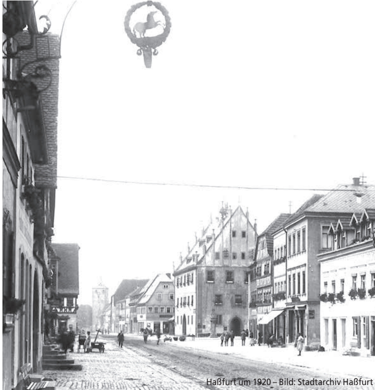
Haßfurt um 1920